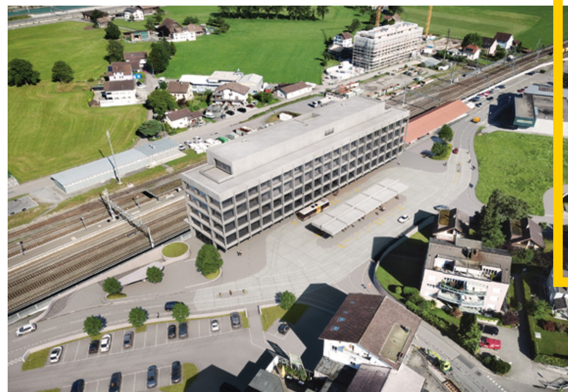
→ Blick von oben: Der Kantonsbahnhof in Altdorf mit dem neuen UKB-Gebäude und dem davor liegenden Bushof.