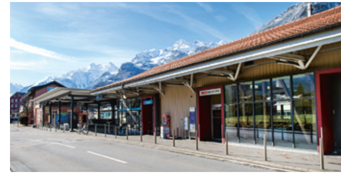
→ Trotz Baustelle werden am Bahnhof Altdorf der öV sowie die Dienstleistungen aufrecht erhalten.